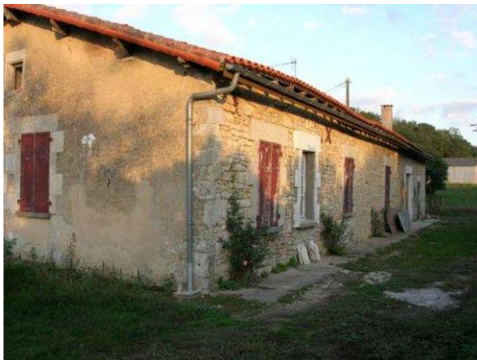
La ferme d'A. Dubreuille à « Marvaud » Saint-Coutant (16).

Par train jusqu'à Lyon, puis Perpignan, en voiture à travers l'Espagne jusqu'à Gibraltar, enfin par avion jusqu'à Londres, Hasler et Sparks regagnent l'Angleterre au début d'avril 1943.