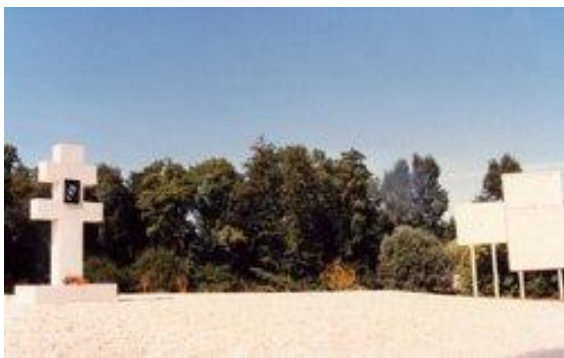
Stèle Bonnier.